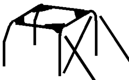
Principe 2 avec les goussets dans les angles